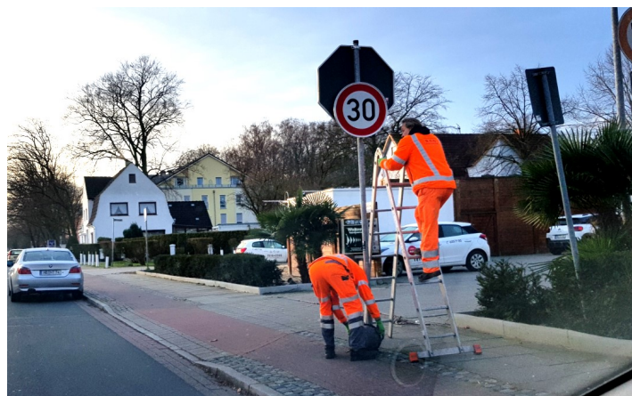
Wie an vielen Stellen in Bremen-Nord gilt neuerdings auch in der Löhstrasse/Ecke Hammersbeckerstr. das Streckengebot „30“